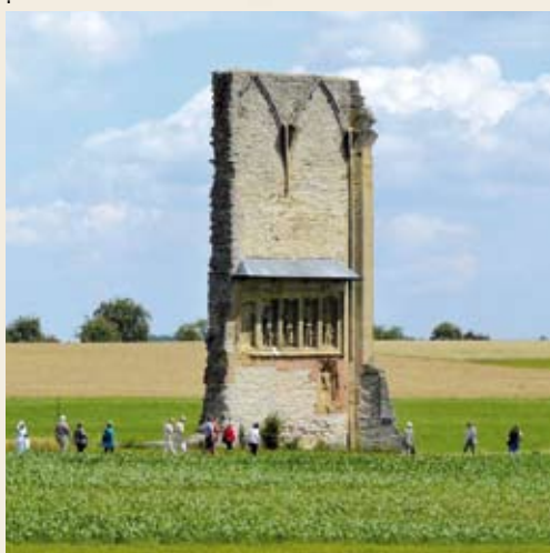
Memorino, CC-BY-SA 3.0

Im Fotowettbewerb „Wiki Loves Monuments“ machten Freiwillige aus ganz Europa im September knapp 170 000 Bilder von Denkmälern für Wikipedia. In vielen Regionen trafen sich engagierte Fotografen, um gemeinsam Motive abzubilden. Hier ein kleiner Rückblick auf das Community-Projekt „Wiki Loves Monuments Mittelhessen“