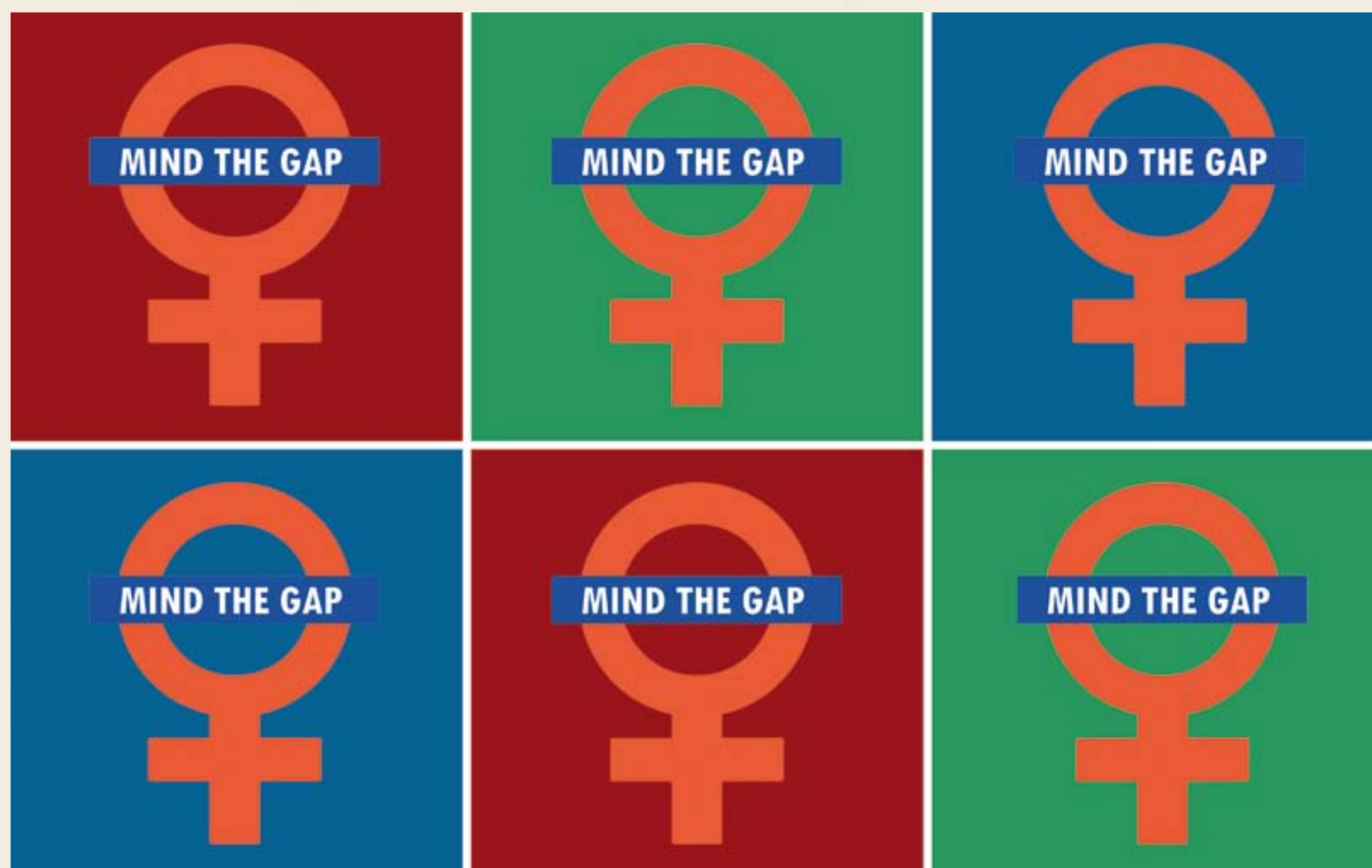
Logo „Mind the Gap“: London Student Feminists, CC-BY-SA 3.0