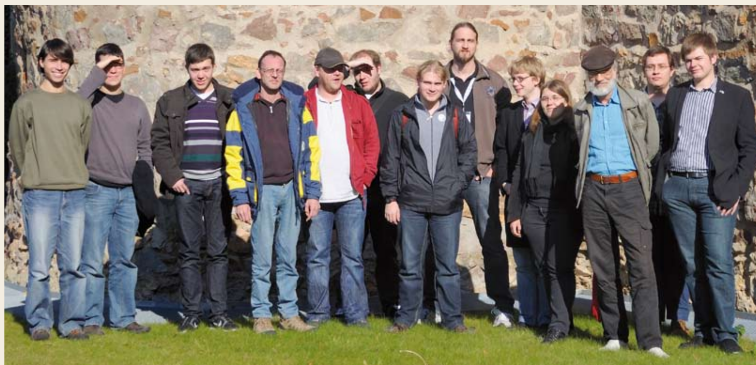
Treffen des Mentorenprogramms in Meißen 2010