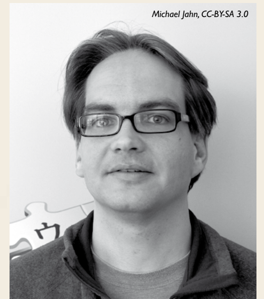
Michael Jahn, CC-BY-SA 3.0