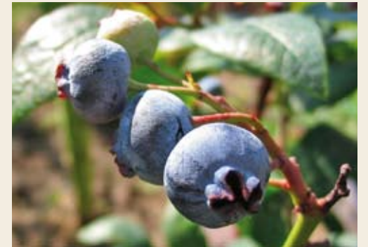
Kulturheidelbeeren, einziger Preis für einen anonymen Autor (2008).

Der erste Wikipedia-Schreibwettbewerb begann im Jahr 2004. Nach nunmehr sieben Jahren und 15 erfolgreichen Auflagen ist der Wettbewerb zu einer Institution für alle geworden, die mit spielerischem Ehrgeiz an das Artikelschreiben für Wikipedia herangehen. Zwei Mal im Jahr wird das Ziel ausgerufen, innerhalb eines begrenzten Zeitraums Artikel neu zu schreiben oder grundlegend umzuarbeiten. Teilnehmer haben mittlerweile die Wahl zwischen verschiedenen Themenfeldern, aus denen eine Jury nach Ablauf der Schreibfrist Einzel- sowie einen Gesamtsieger kürt. Letzteren gewann in der 15. Ausgabe des Wettbewerbs der Artikel „Massaker von Katyn“ vom Wikipedia-Benutzer mit dem Namen „Kopilot“. Zusätzlich gehört die Vergabe von Publikumspreisen auch schon seit Jahren zum guten Ton des Schreibwettbewerbs. Doch nicht nur die Autoren der eingereichten Artikel werden geehrt: Seit 2010 wird zusätzlich der so genannte Reviewpreis vergeben. Damit werden besonders aktive Helfer ausgezeichnet, die während der öffentlichen Schreibphase guten Rat und Verbesserungsvorschläge beisteuern. Auch wenn es Preise für die Gewinner gibt, steht traditionell der Spaß im Vordergrund. Nebenbei ist damit eine der erfolgreichsten Autoreninitiativen in Wikipedia entstanden. (mj)