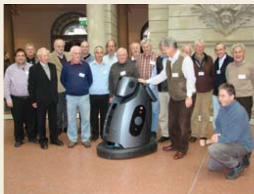
Gruppenfoto der Posthistoriker

Während die Über-60-Jährigen in Deutschland rund ein Viertel der Bevölkerung ausmacht, sind sie unter den Autoren der Wikipedia unterrepräsentiert.